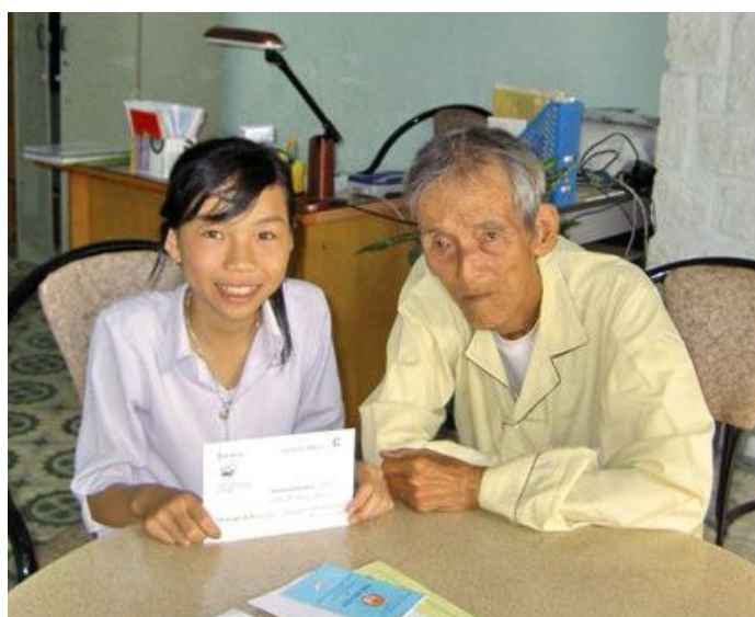
En 2007-2008 avec son grand père